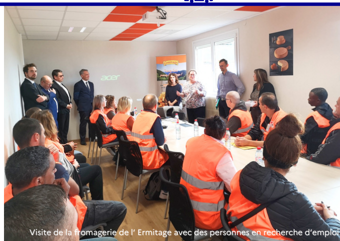
Visite de la fromagerie de l'Ermitage avec des personnes en recherche d'emploi

Le laboratoire accompagne son déploiement dans d'autres communes du département.