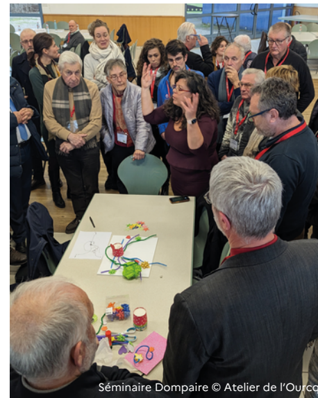
Séminaire Dompain